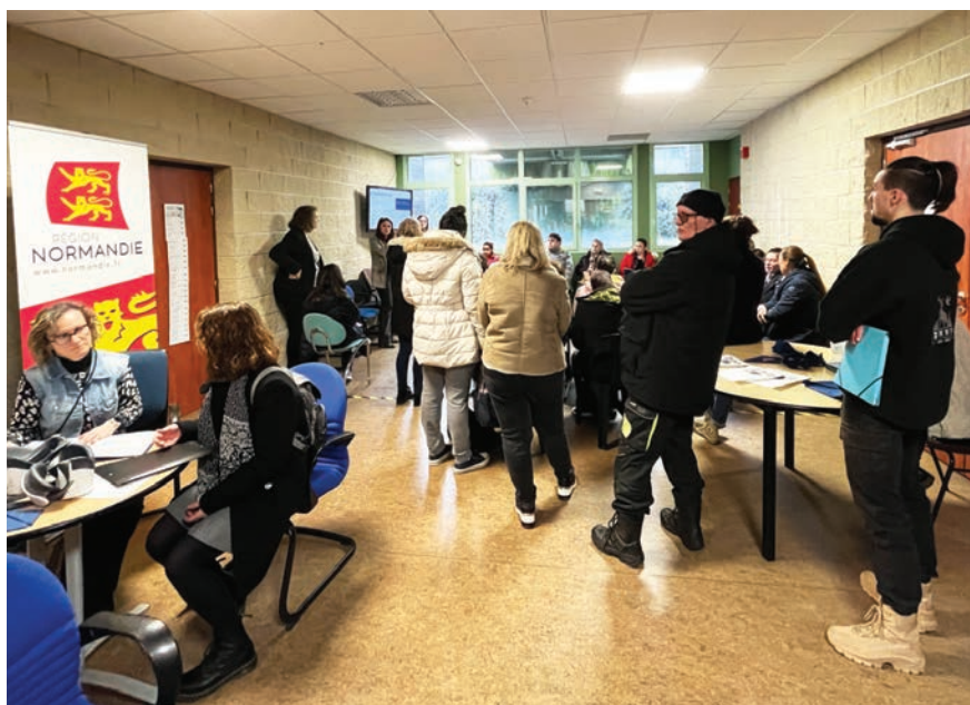
Les demandeurs d'emploi à la rencontre des entreprises du territoire