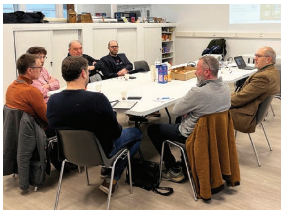
Des premiers échanges entre les élus et les chefs d'entreprise au sein de la Forge à Saint-Rémy-sur-Orne

semestrielles devraient être prévues désormais.