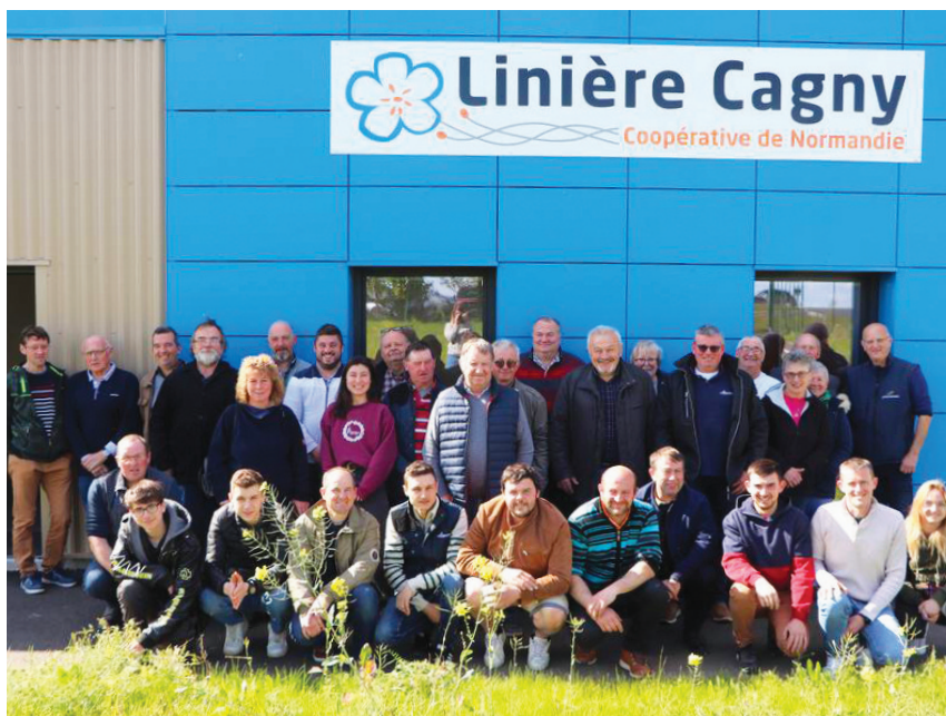
Les adhérents de la coopérative devant les locaux neufs de la Coopérative linière de Cagny située à Cintheaux