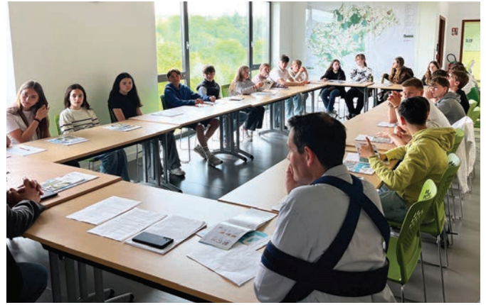
Les élèves du collège posant des questions sur le fonctionnement de la collectivité

La Communauté de communes Cingal-Suisse Normande a reçu, le jeudi 23 mai 2024, 24 élèves de 4 e du collège Roger Bellair de Thury-Harcourt-le-Hom. Cet après-midi avait pour objectif de présenter les différents métiers au sein de la collectivité et de faire visiter les locaux, ainsi que ceux du centre Aquasud et du restaurant Le Fil du Temps afin de sensibiliser les jeunes aux métiers présents sur le territoire.