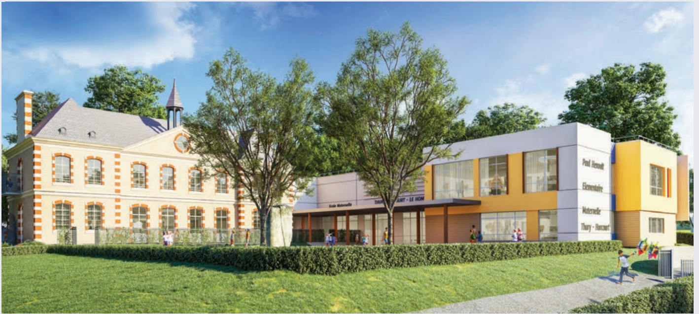
Vue 3D du projet de restructuration du groupe scolaire Paul Hérault