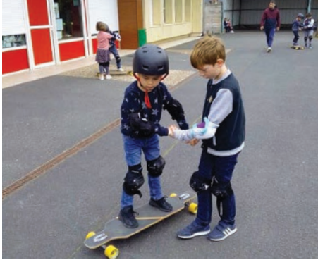
Un autre moyen de se déplacer : initiation au longboard

Un projet autour de la mobilité pour les centres de loisirs situés à Bretteville-sur-Laize et Saint-Sylvain, sous l'égide de la Ligue de l'Enseignement.