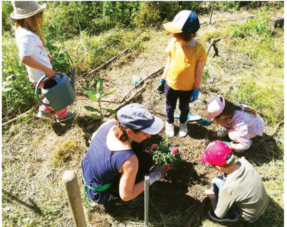
Atelier jardin accompagné par le CPIE Vallée de l'Orne