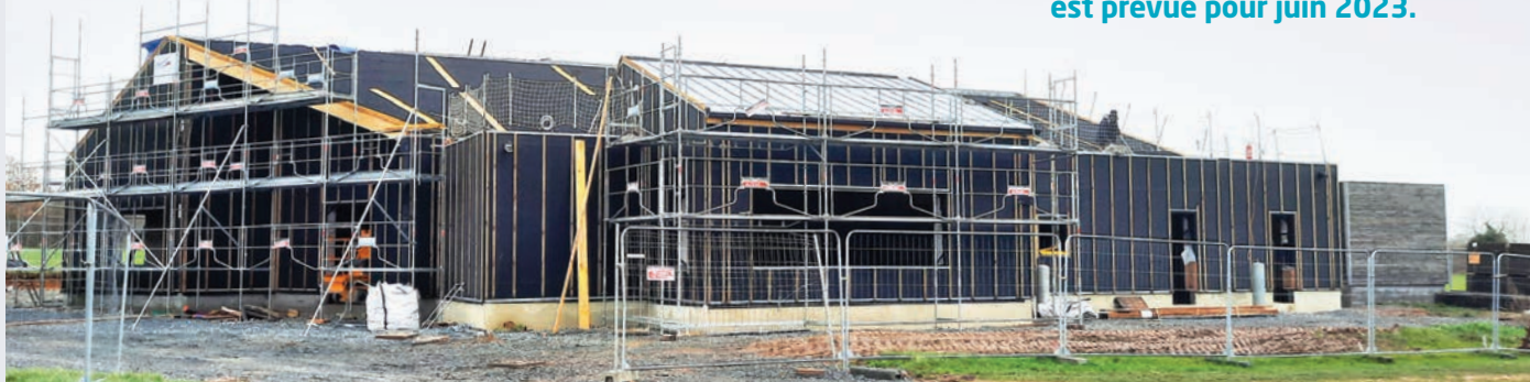
Futur bâtiment Petite Enfance à Gouvix

L'ouverture de ces deux équipements est prévue pour juin 2023.