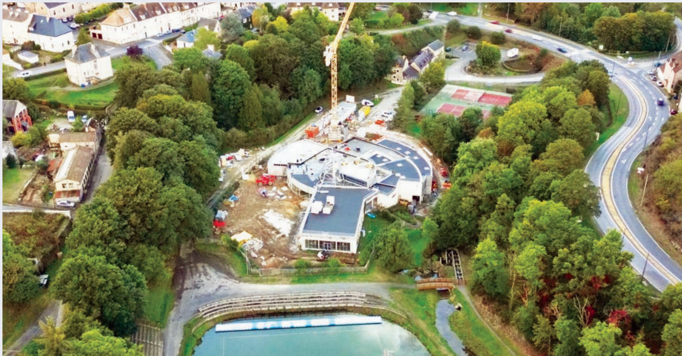
Travaux du centre aquatique