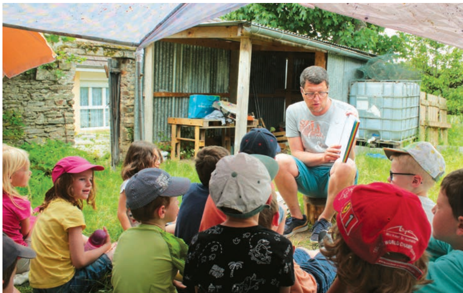
Séance lecture pour les enfants du territoire

Parallèlement, la communauté de communes a accompagné et soutenu à hauteur de 7 000€ trois opérations inscrites au plan d'actions issues du contrat. Celles-ci ont également été soutenues financièrement par la DRAC et le Département du Calvados.