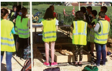
Les élèves de 5 e sur le chantier de fouilles

Cette action a débuté en mai 2021 par une fouille archéologique menée à Bretteville-sur-Laize. À cette occasion, les classes de 5 e du collège du Cingal situé à Bretteville-sur-Laize ont pu venir à la rencontre des archéologues pour découvrir leur métier et s'initier aux rites funéraires antiques, comme autant d'invitations à partir à la découverte de la civilisation latine et de ses croyances. Un cimetière mérovingien de 3 000 tombes a été découvert. Le projet s'est clôturé en juin 2022 par une exposition de créations artistiques des élèves.