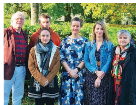
Une partie de l'équipe des professeurs

Les inscriptions ont lieu chaque année en septembre - À partir de 6 ans