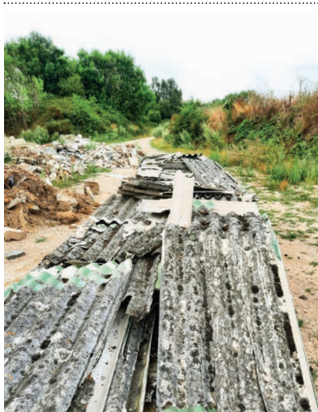
Dépôt sauvage d'amiante

Merci de leur réserver le meilleur accueil lors de leur visite.