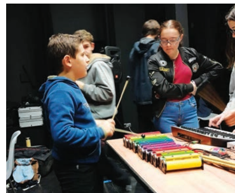
Action culturelle du groupe Gablé

Le groupe Gablé, fondé depuis une quinzaine d'années, réalisé un nouvel