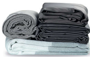
Linge de maison