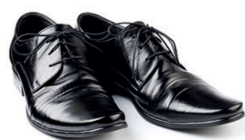
Chaussures (par paire)