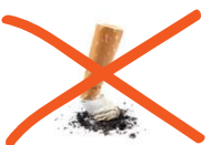
Mégots de cigarette