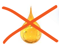
Huiles et graisses