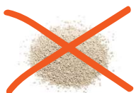
Litières d'animaux (même biodégradables)