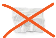
Mouchoirs en papier