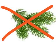
Résineux (thuyas, aiguilles de pin,...)