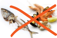
Poissons, coquillages et crustacés