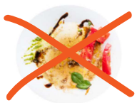
Plats en sauce et restes de viande