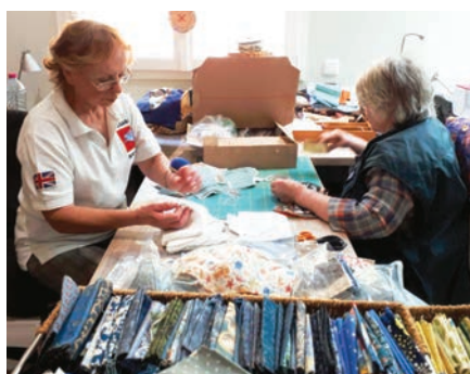
Atelier de fabrication de masques à Le Bô

Deux habitantes bénévoles du Bô ayant lancé un atelier de fabrication de masques en tissu, ont proposé à Madame le Maire de participer à la fabrication des