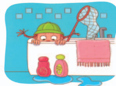
J'en ai trouvé dans la salle de bain,