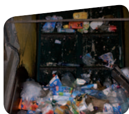
Les déchets partent vers la chaîne de tri