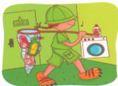
à côté de la machine à laver, sous le lit de mon grand frère, sur la table du salon,