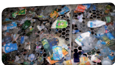
Passage des produits sur le crible pour permettre ! de faire passer les morceaux (verre, terre, ...) difficiles à attraper avec les gants.