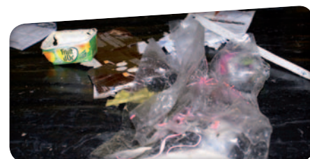
Refus de tri sur la chaîne de tri : tous les produits à ne pas mettre dans les conteneurs des points d'apport volontaire (plastiques d'emballage, polystyrène, ...)