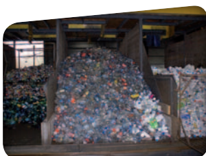
Stockage des produits par catégorie