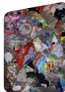
Benne des refus de tri.