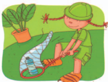
la chasse aux bouteilles et flacons plastiques vides.