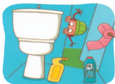
dans les toilettes,