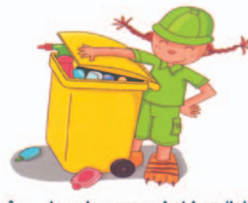
et même dans le garage ! et hop j'ai rempli toute la poubelle de collecte sélective, trop fort !