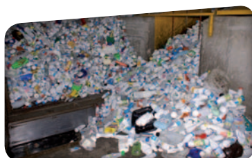
Les produits partent sur un tapis roulant vers une presse pour la mise en balle