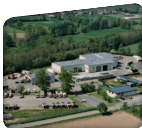
Vue du centre de tri