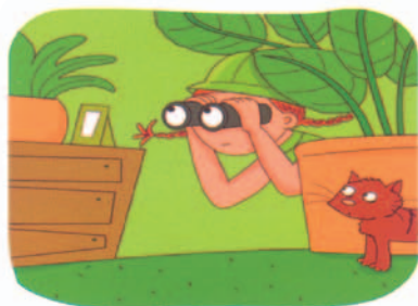
Aujourd'hui c'est jour de chasse,