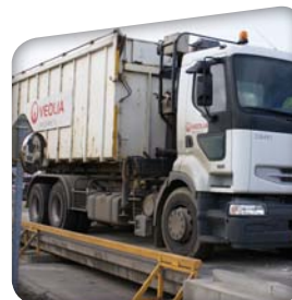
Pesée du camion