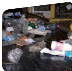
Les trieurs séparent les déchets par catégorie