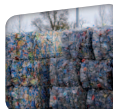
stockage des balles avant leur reprise par des entreprises spécialisées